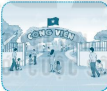
công v h i ên h ...