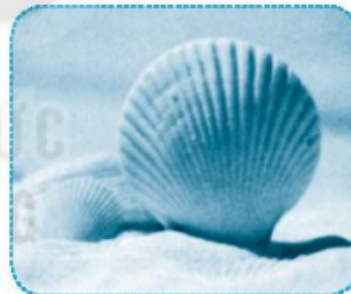
sò đ h i ệp h ...

Câu 3 (trang 55 VBT Tiếng Việt lớp 1 Tập 1)