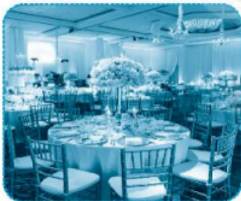
bữa t h i êc h ...