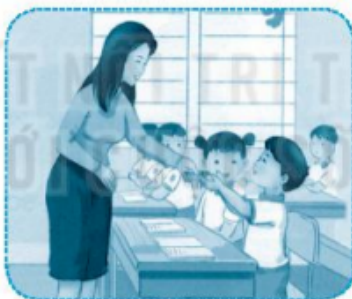
.. lớp ... học