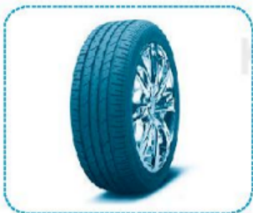
lốp ... ô tô