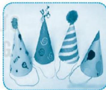
mũ .. chóp ...

Câu 3 (trang 49 vở bài tập Tiếng Việt lớp 1 Tập 1)