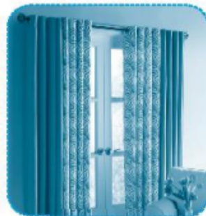
r ê m cửa

Câu 3 (trang 35 vở bài tập Tiếng Việt lớp 1 Tập 1)