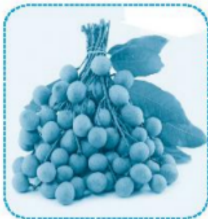
chùm nh ân