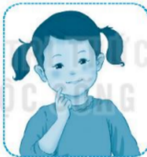
túm t ì m