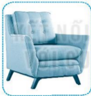
ghế đ ê m