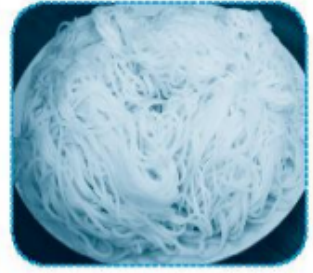
đĩa b ùn

Câu 3 (trang 32 vở bài tập Tiếng Việt lớp 1 Tập 1)