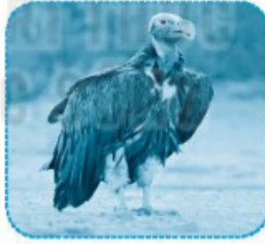
kền k ên