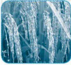
lúa ch ín ..