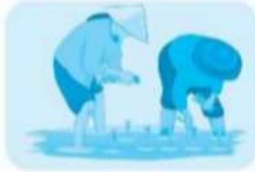
cúi lom khom