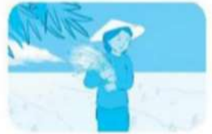
ôm bó lúa

Câu 2. Điền vào chỗ trống (trang 43 VBT Tiếng Việt lớp 1 Tập 1)