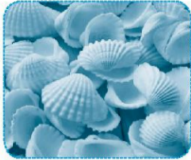
vỏ s ò