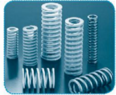
lò x o