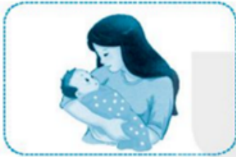
mẹ u bé