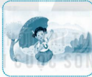
ch e ô