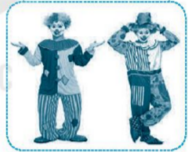
ch ú hễ

Câu 3 (trang 16 VBT Tiếng Việt lớp 1 Tập 1)