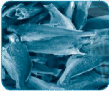
cá kh ô