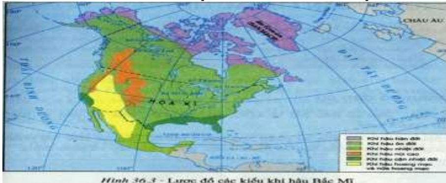
Hình 36.3 - Lược đồ các kiểu khí hậu Bắc Mỹ

Câu 22 (VD): Quan sát lược đồ sau ta thấy, ở phần lớn phía Tây và phần lớn phía Đông kinh tuyến 100°T của Hoa Kỳ có sự khác nhau về khí hậu như thế nào?