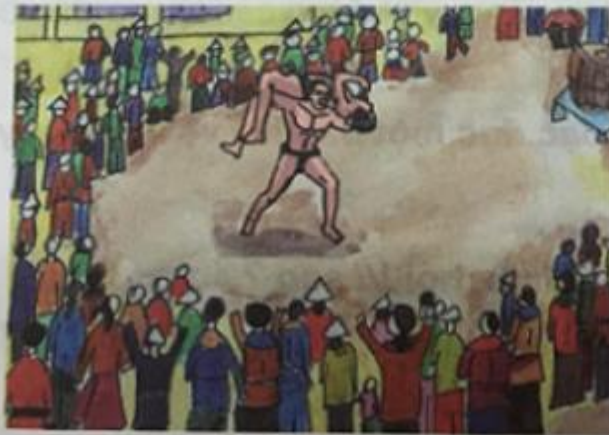
Đoạn 5 : Kết thúc keo vật.