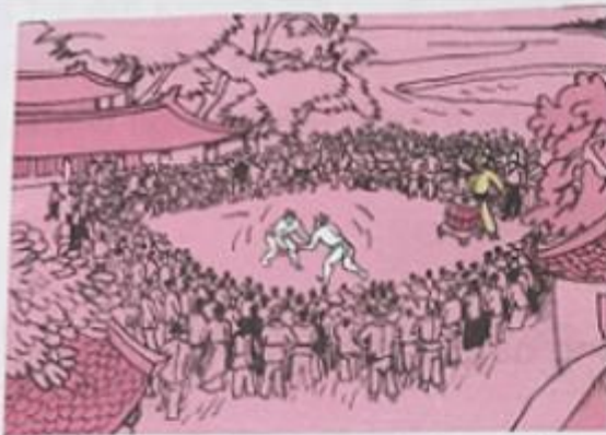
Đoạn 1 : Cảnh mọi người đi xem hội.