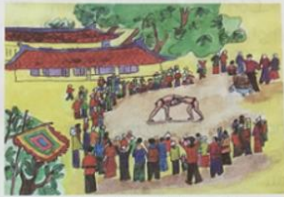
Đoạn 2 : Mở đầu keo vật.