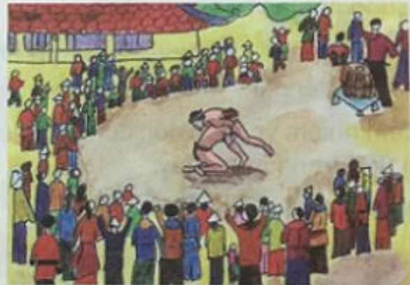
Đoạn 4 : Thế vật bẻ tắc của Quắm Đen.