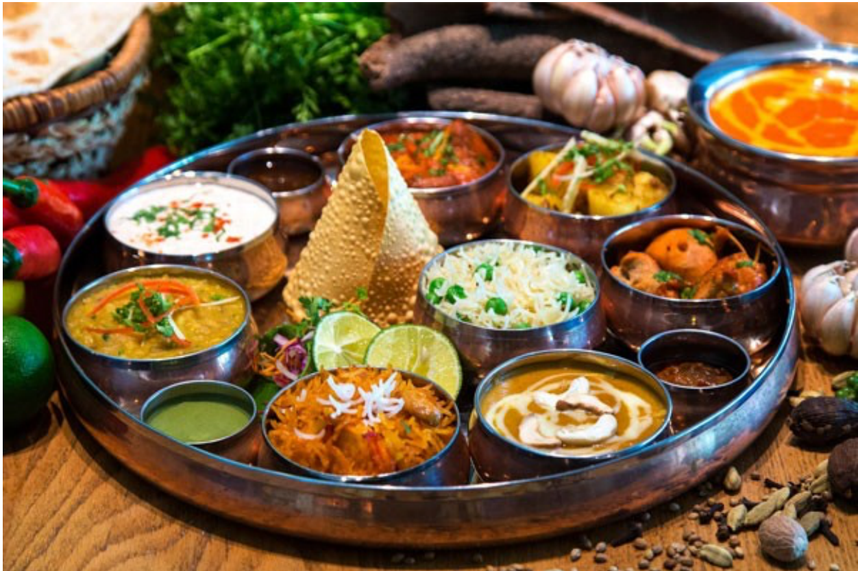
Ẩm thực phong phú, đặc sắc của người Ấn Độ

Với các dân tộc cùng chịu ảnh hưởng của văn hóa Ấn Độ, chúng ta sẽ gặp một bức tranh lễ tết năm mới rất gần nhau. Bao gồm cả thời gian tiến hành lễ hội, mục đích và tính chất lễ hội.