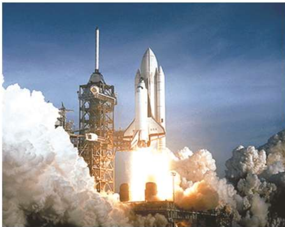
Tàu con thoi của Mỹ đang được phóng lên

=> Nền kinh tế Mỹ không ngừng tăng trưởng, đời sống vật chất, tinh thần của người dân có nhiều thay đổi.