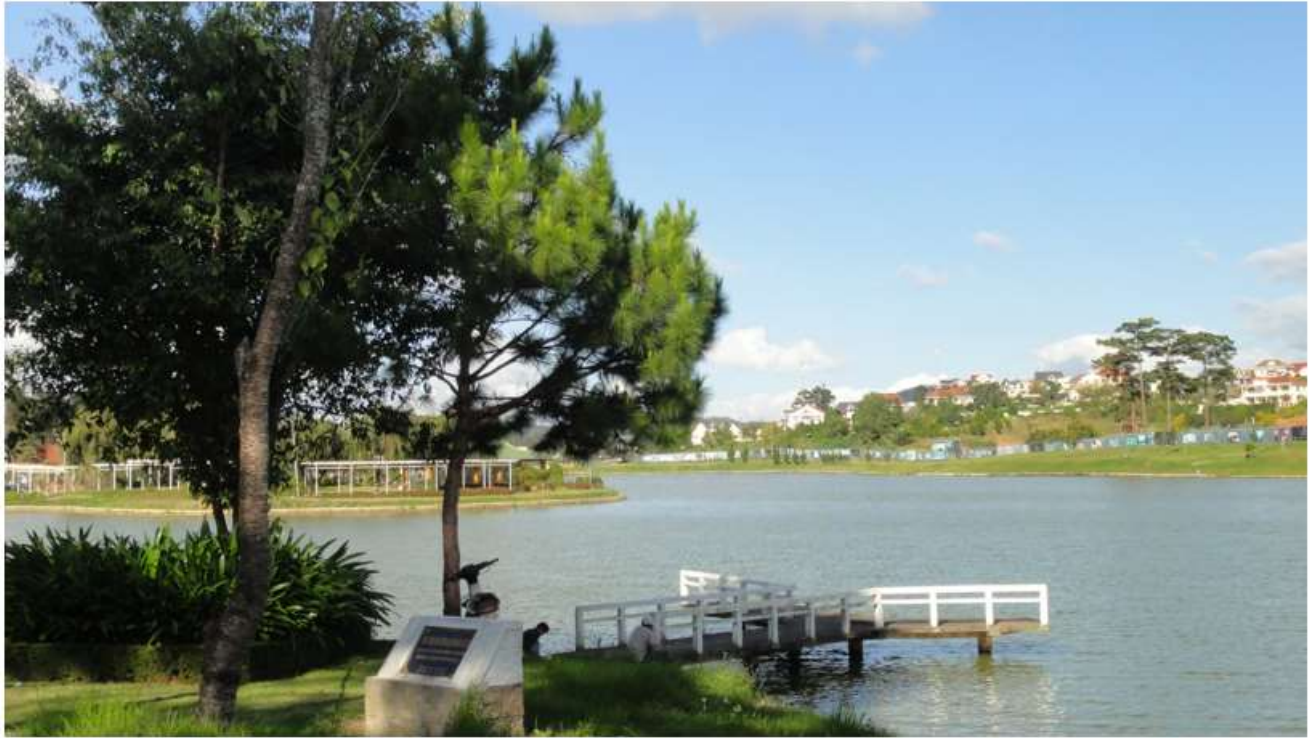
Hồ Xuân Hương (Đà Lạt)