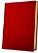
a red book