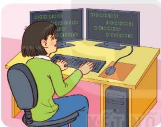
Lập trình viên