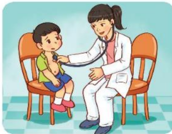
Bác sĩ nhi khoa