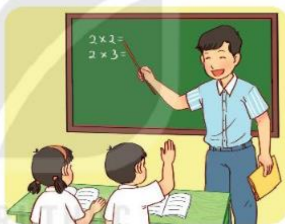
Hay là một giáo viên?

Em có muốn biết ước mơ về công việc trong tương lai của các bạn trong lớp không?