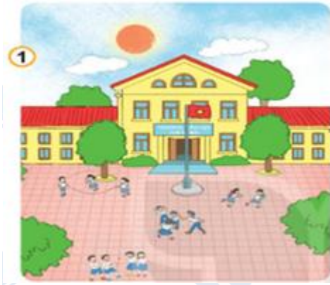
Hình 1: Trường học