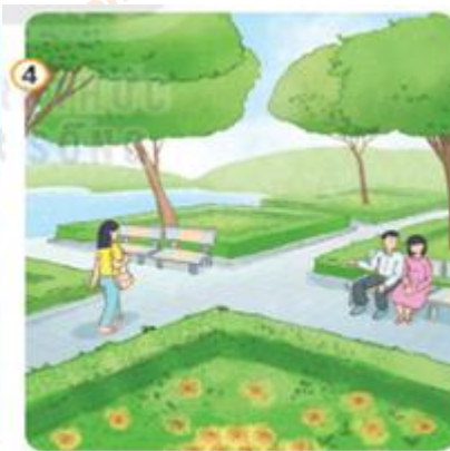
Hình 4: Công viên