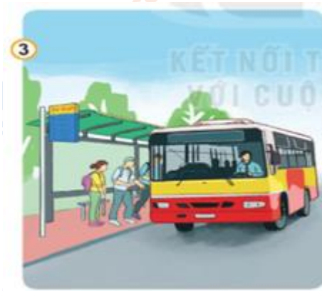
Hình 3: Bến xe bus