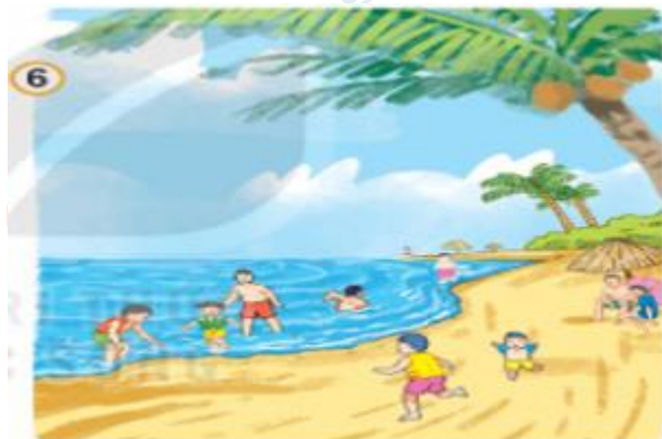
Hình 6: Quy định ở bãi biển