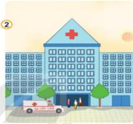
Hình 2: Bệnh viện