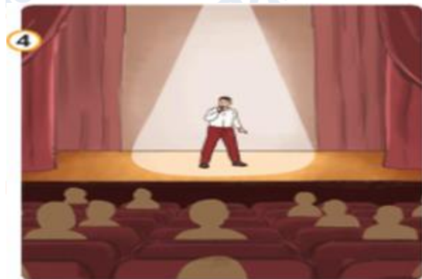
Hình 4: Quy định khi đi xem ca nhạc