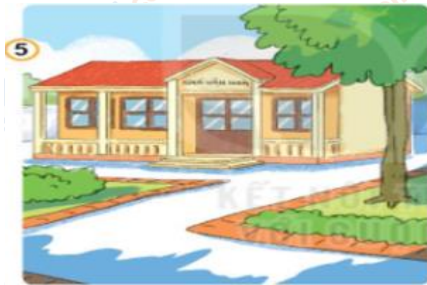
Hình 5: Quy định ở nhà văn hóa