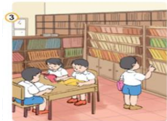
Hình 3: Quy định ở thư viện