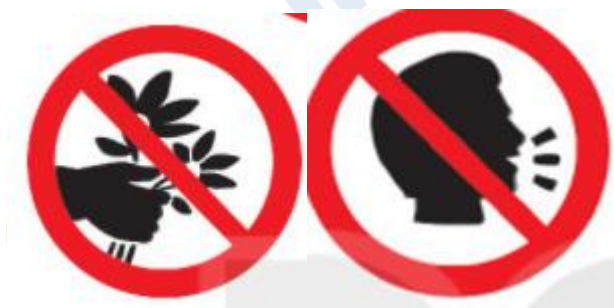
Cấm hái hoa