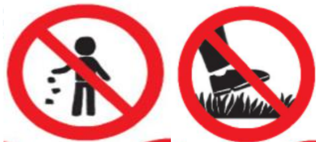
Cấm vứt rác bừa bãi