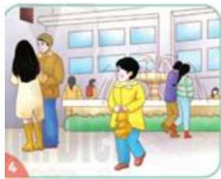
(Hình ảnh: Trang 31 SGK)

Trẻ em có thể bị lạc ở phố, những nơi đông người.