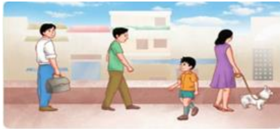
Hình ảnh: Trang 32 SGK