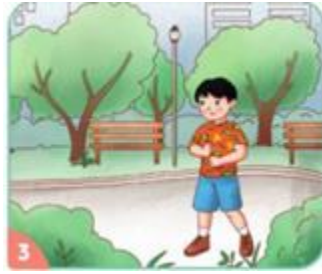
(Hình ảnh: Trang 31 SGK)