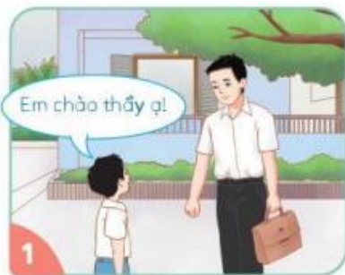
Chào hỏi khi gặp thầy giáo