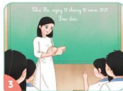
Giơ tay khi muốn phát biểu ý kiến