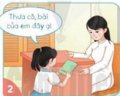
Đưa vở cho cô bằng hai tay