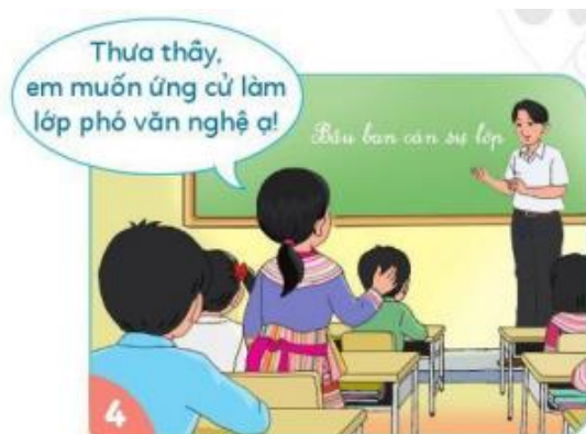
Đứng lên thưa thầy khi muốn ứng cử làm ban cán sự lớp