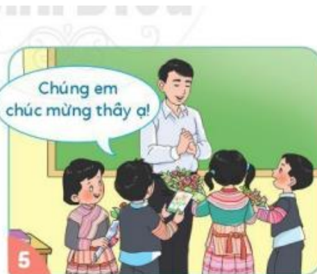
Tặng hoa và gửi lời chúc đến thầy giáo nhân dịp lễ