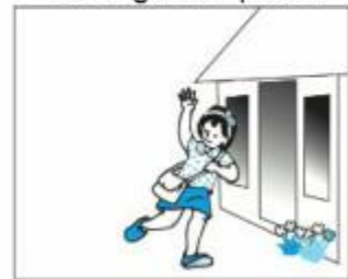
Mai tan học về lúc 11 giờ 30 phút.