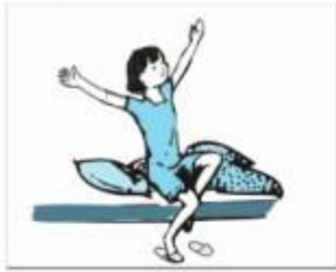
Mai ngủ dậy lúc 6 giờ.