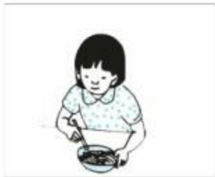
Mai ăn sáng lúc 6 giờ 15 phút.