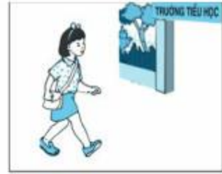
Mai đến trường lúc 7 giờ 15 phút.