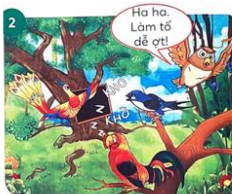
Khi phượng hoàng nói câu tìm nơi làm tổ trên cây, cú...