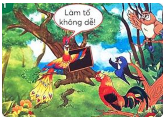
Thầy giáo phượng hoàng dạy các loài chim về cách xây tổ. Nó nói: