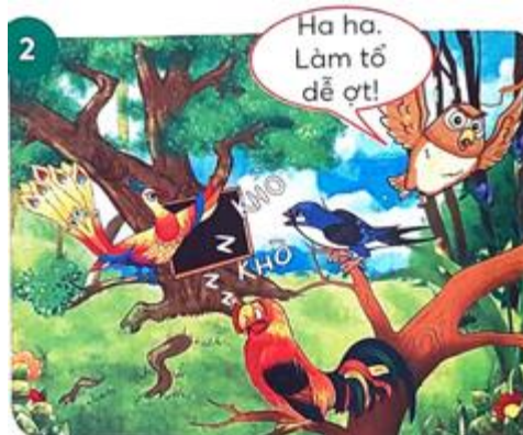
Khi phượng hoàng nói câu tìm nơi làm tổ trên cây, cú nghĩ là xây tổ dễ ợt nên liền bay đi.