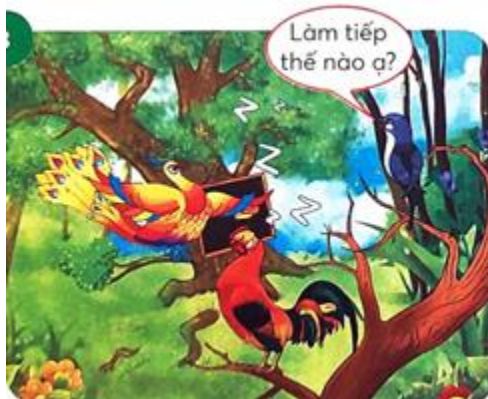
Khi phượng hoàng tiếp tục giảng giải, chim én...