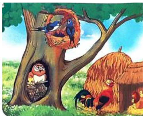
Nhờ chịu khó nghe giảng, chim én...