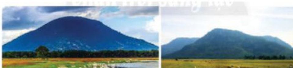
Núi Bà Đen (Tây Ninh)