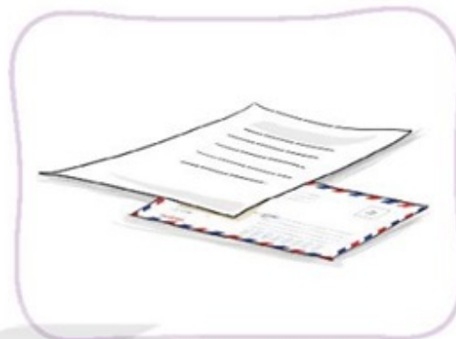
Viết lời động viên, thăm hỏi bạn