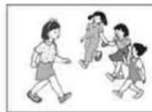
Em ra chơi lúc 9 giờ 30 phút.