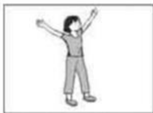
Em tập thể dục lúc 6 giờ.

Giải câu 2. Nối mỗi bức tranh với đồng hồ tương ứng :