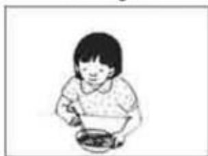
Em ăn sáng lúc 6 giờ 15 phút.