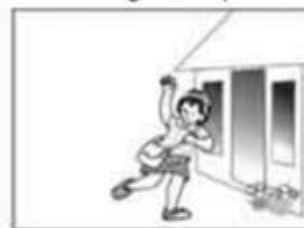
Em tan học lúc 11 giờ 30 phút.