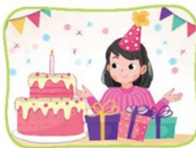
Dự sinh nhật bạn