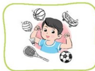
Tập thể thao

- Giải thích lí do nên lựa chọn trang phục phù hợp cho từng hoạt động.