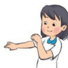
Mặc quần áo