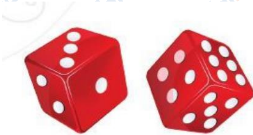
Sáu mặt của xúc xắc