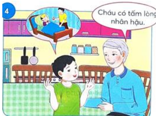
Cậu bé mang quả đào tặng người bạn bị ốm. Ông nói rằng "Cháu có tấm lòng nhân hậu"