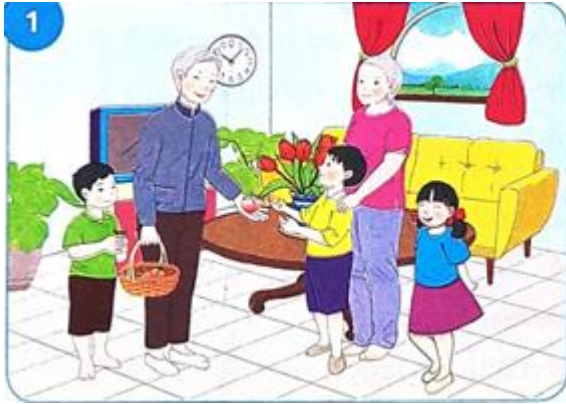
Người ông mang về một giỏ đào cho vợ và những người cháu của mình.