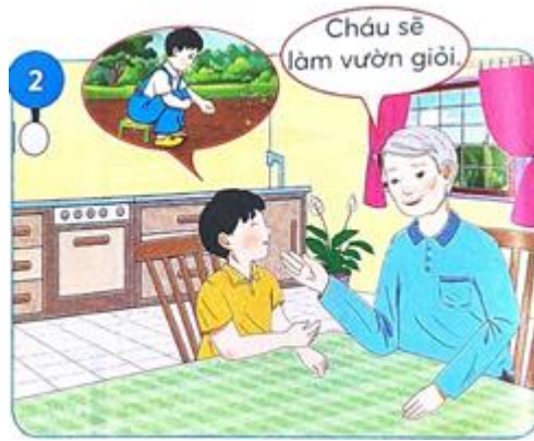
Cậu bé mang hạt đào đi trồng. Ông nói rằng "Cháu sẽ làm vườn giỏi"