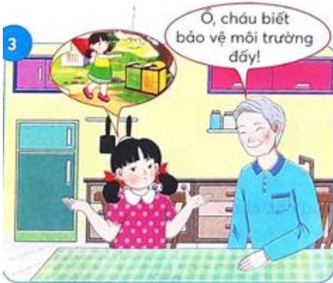
Cô bé đem hạt đào bỏ vào thùng rác. Ông nói rằng "Ồ, cháu biết bảo vệ môi trường đấy!"