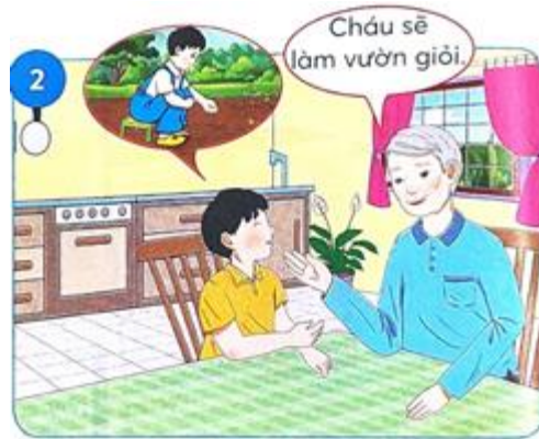
Cậu bé Xuân nói:

- Đào ngon và thật là thơm. Cháu đã đem hạt đào đi trồng. Chẳng bao lâu nó sẽ mọc lên thành một cây đào to. Ông nhỉ?