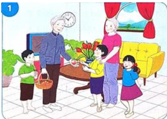
Ông mang về bốn quả đào cho bà và ba người cháu của mình.