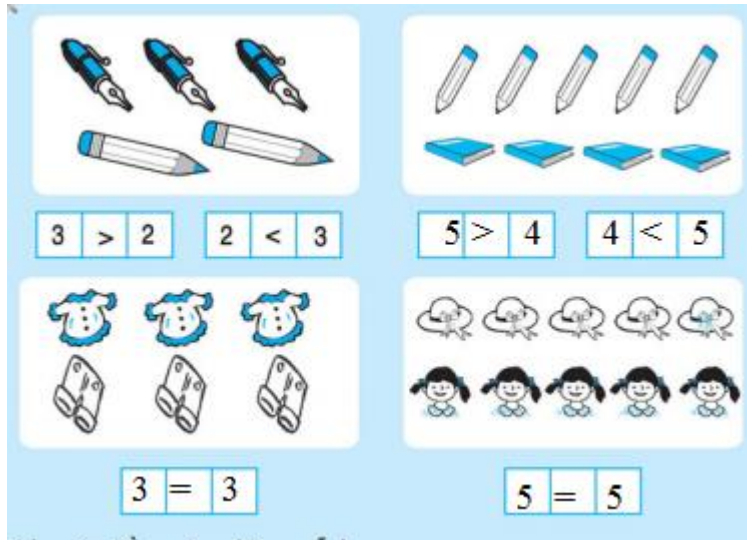
Hình 2: 5 > 4 và 4 < 5