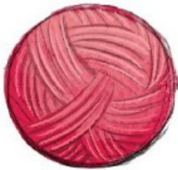
Làm quả bông bằng sợi len