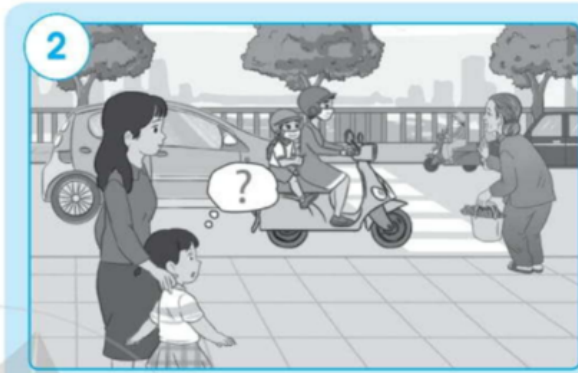
Em sẽ nhờ mẹ giúp cù sang đường còn em sẽ xách đồ giúp cù