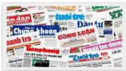
Top 4 cuốn sách hay về báo chí | Edu2Review