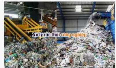
XỬ LÝ CHẤT THẢI CÔNG NGHIỆP - Sơn Báu

2. Xác định địa điểm, thời gian phù hợp với chủ đề, kế hoạch học tập và điều kiện thực tế ở địa phương (có thể chọn một khu du lịch; nhà máy, cơ sở sản xuất công nghiệp; cánh đồng, trang trại chăn nuôi gia cầm, gia súc, thủy sản,...).