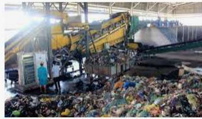
4 phương pháp xử lý chất thải – rác thải hiệu quả nhất h...