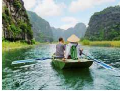
Du Lịch Sinh Thái Là Gì? Tổng Quan Về ...