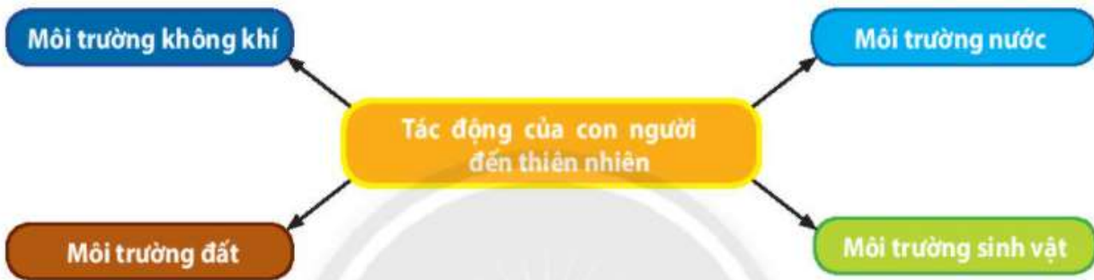
Hình 24.1. Sơ đồ thể hiện một số tác động của con người đến thiên nhiên