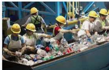
Nhà máy xử lý chất thải đầu tiên của Bắc Ninh