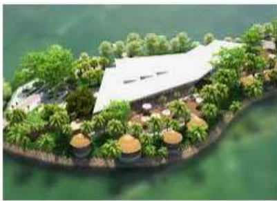
Khu du lịch sinh thái Lã Vọng - Eden Land...

* Xác định địa điểm, thời gian phù hợp, kế hoạch học tập và điều kiện thực tế ở địa phương