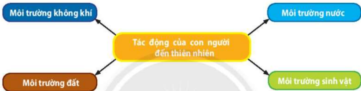
Hình 24.1. Sơ đồ thể hiện một số tác động của con người đến thiên nhiên