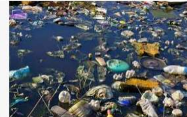
Ô nhiễm môi trường nước là gì? Hậu quả của ô nhiễm.