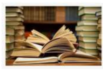
sách báo: Tin tức, Video, hình ảnh sách báo | Ca...