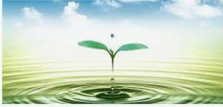
Môi trường nước được hiểu là môi trường mà những cá thể tồn ...