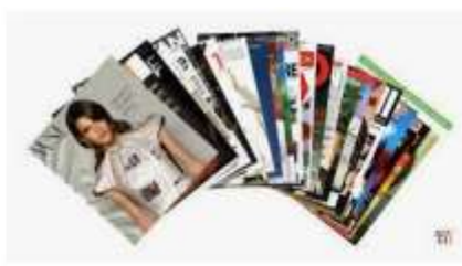
In sách, báo, tạp chí giá rẻ