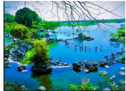
Phát triển du lịch sinh thái Khu Bảo tồn T...