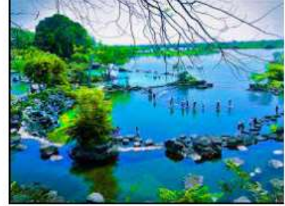
Phát triển du lịch sinh thái Khu Bảo tồn T...