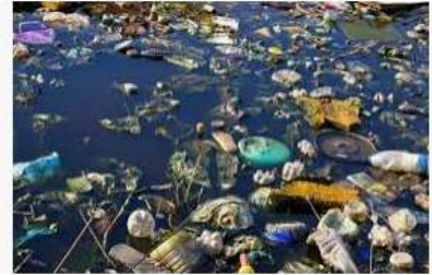
Ô nhiễm môi trường nước là gì? Hậu quả của ô nhiễm.