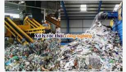
XỬ LÝ CHẤT THẢI CÔNG NGHIỆP - Sơn Báu

* Xác định địa điểm, thời gian phù hợp, kế hoạch học tập và điều kiện thực tế ở địa phương