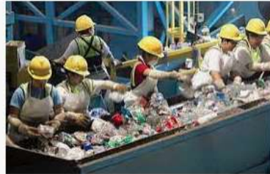
Nhà máy xử lý chất thải đầu tiên của Bắc Ninh