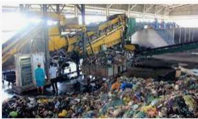
4 phương pháp xử lý chất thải – rác thải hiệu quả nhất h...

1. Lựa chọn chủ đề: xác định nội dung ở mục I, chọn một chủ đề phù hợp (vấn đề xử lý nước thải của một cơ sở sản xuất công nghiệp; tác động của khí thải nhà máy đến môi trường không khí, ảnh hưởng của phân bón, thuốc trừ sâu,... đến môi trường đất, nước, không khí,...; vấn đề thu gom và xử lý rác thải ở khu du lịch,...).