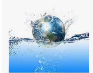
Ô nhiễm môi trường nước đang ở mức ...