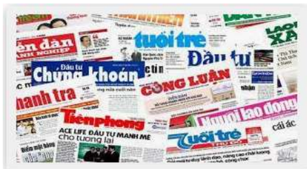
Top 4 cuốn sách hay về báo chí | Edu2Review