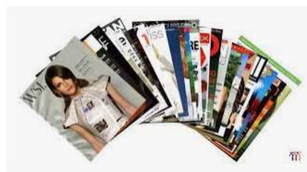
In sách, báo, tạp chí giá rẻ