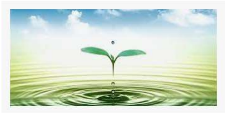
Môi trường nước được hiểu là môi trường mà những cá thể tồn ...