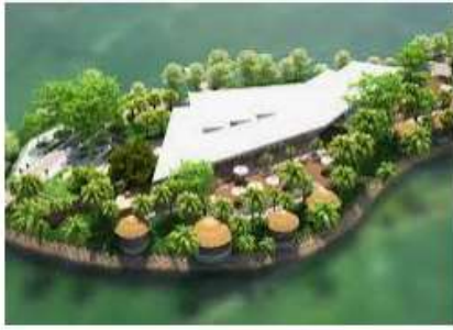
Khu du lịch sinh thái Lã Vọng - Eden Land...