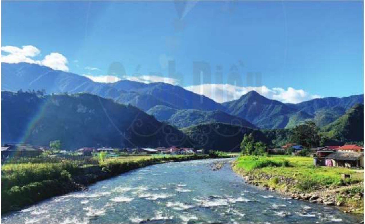
Hình 12.2. Một góc của vùng đồi núi Tây Bắc nước ta (ảnh chụp tại xã Ngọc Chiến, huyện Mường La, tỉnh Sơn La)