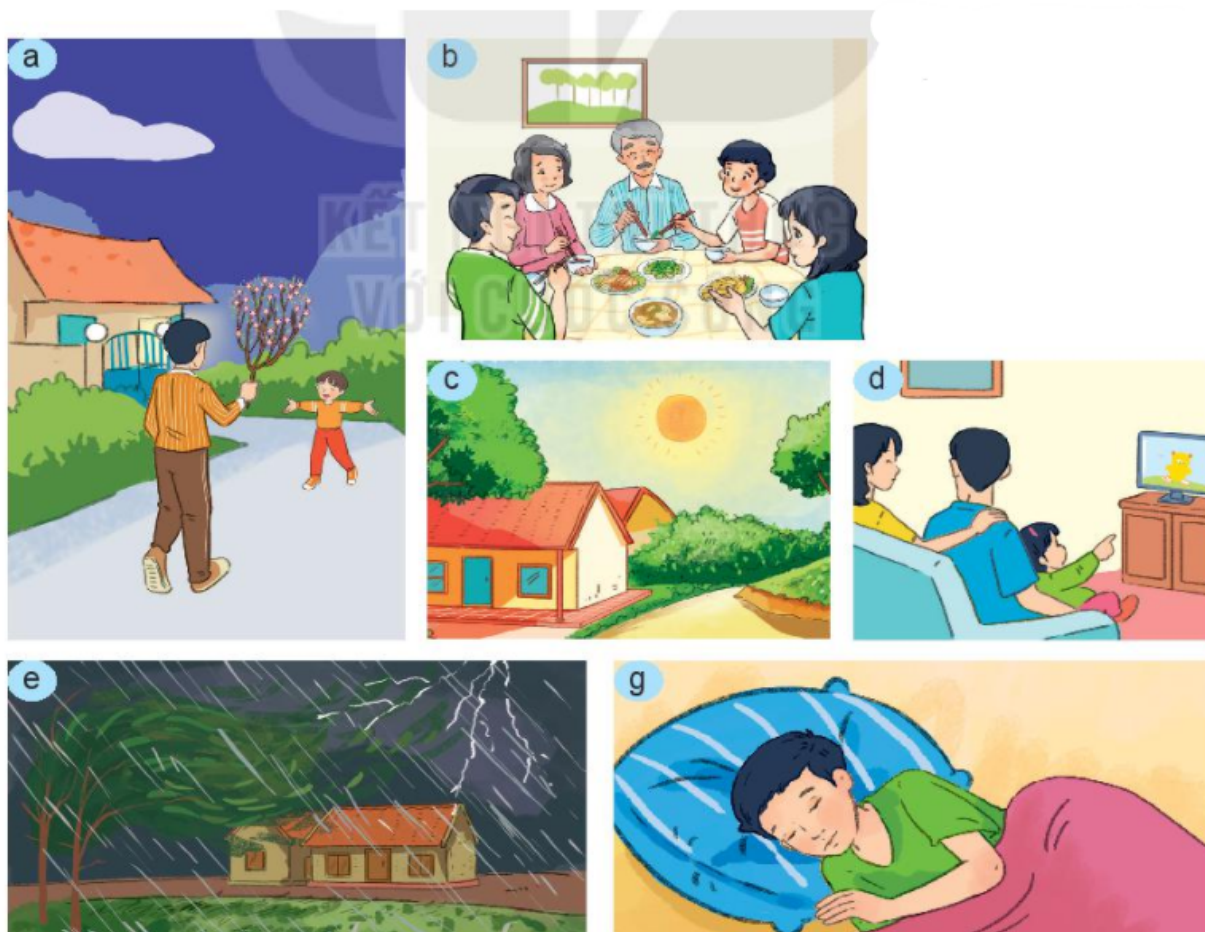
Hình 1.1. Vai trò của nhà ở

Quan sát hình 1.1 và cho biết con người cần có nhà ở?