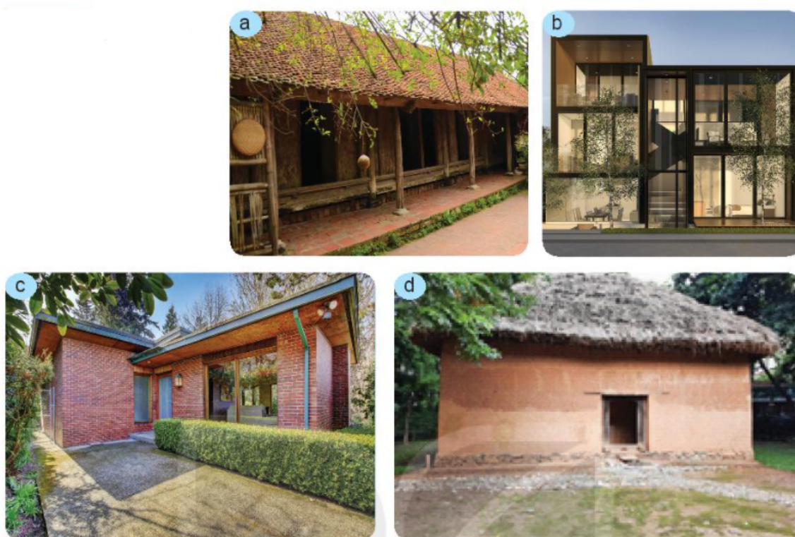
Hình 2.2. Nhà ở được xây dựng bằng những vật liệu khác nhau

Xác định một số loại vật liệu cơ bản được dùng để xây dựng các ngôi nhà trong hình 2.2.