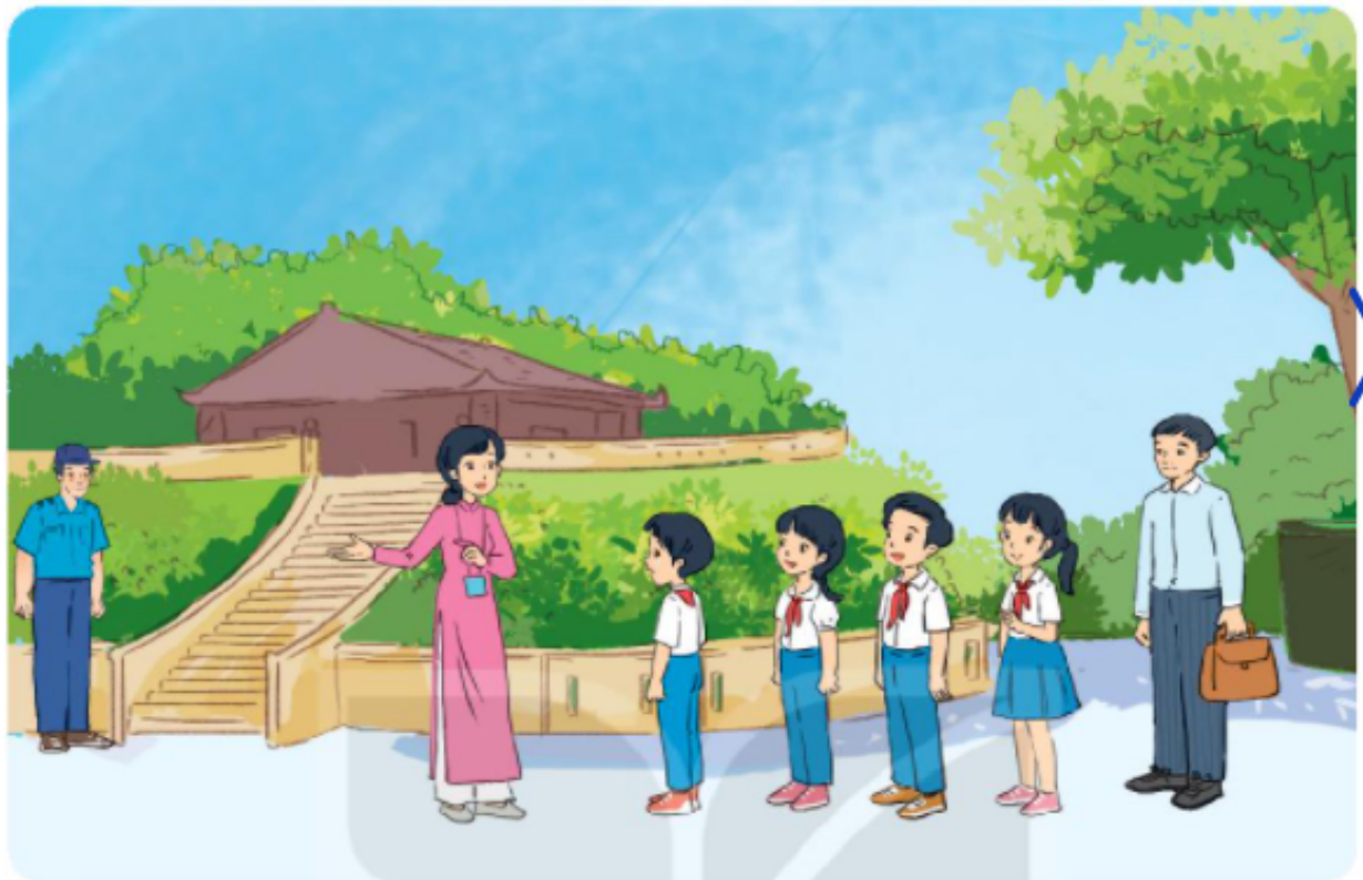
Hình 7.2. Trang phục trong đời sống

Quan sát Hình 7.2 và cho biết các nhân vật trong hình sử dụng trang phục gì. Nêu vai trò của các bộ trang phục đó.