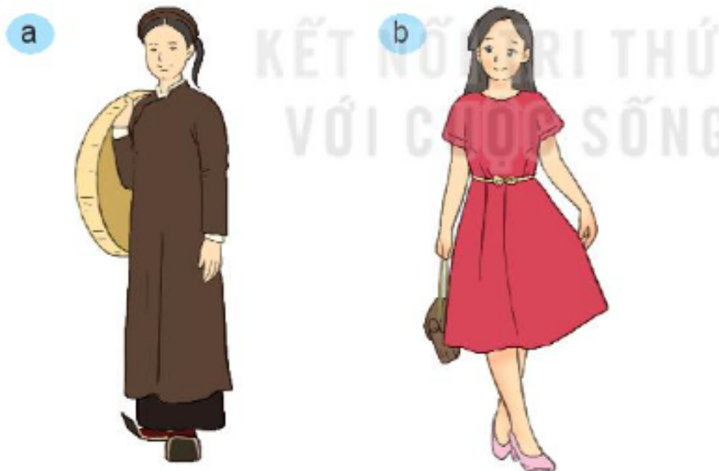
Hình 9.1. Thời trang của phụ nữ Việt Nam thế kỉ XIX (a) và hiện nay (b)