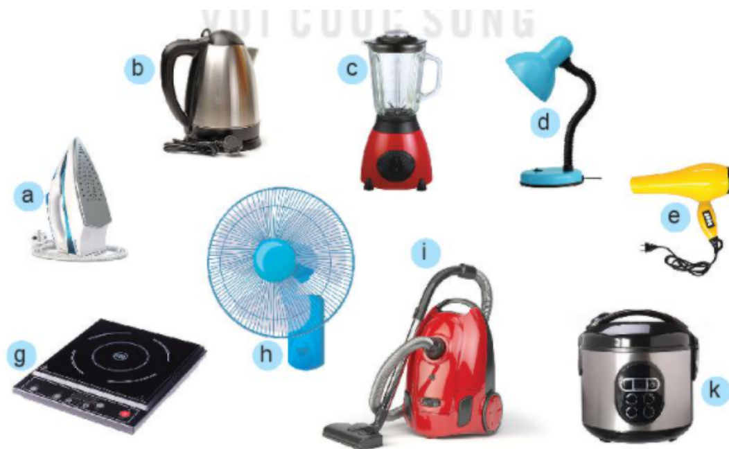
Hình 10.1. Một số đồ dùng điện trong gia đình