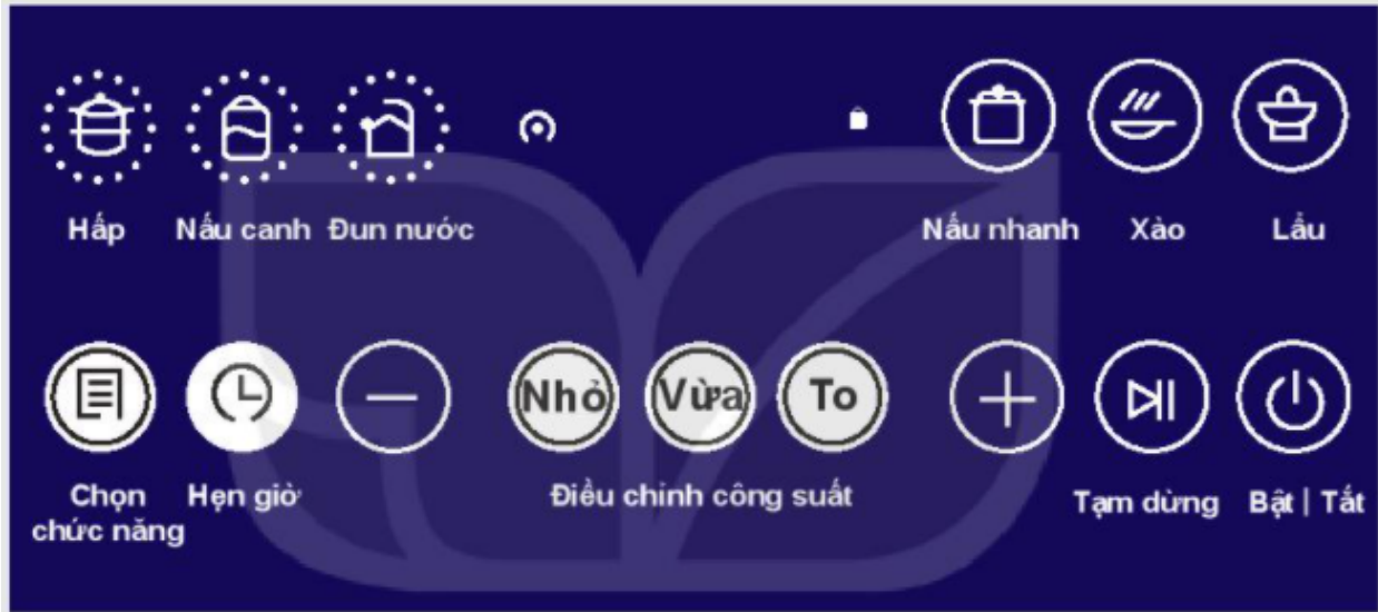
Hình 13.3. Bảng điều khiển của bếp điện