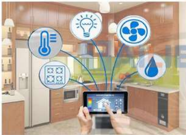
Giám sát hoạt động của các đồ dùng điện trong nhà bằng điện thoại thông minh