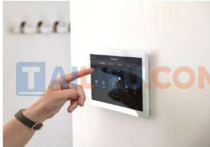
Cài đặt chương trình hoạt động của các đồ dùng điện trong nhà