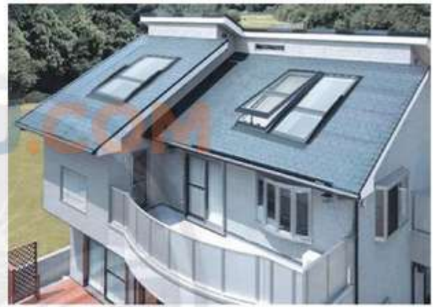
Sử dụng hệ thống đón gió và ánh sáng mặt trời