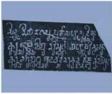
Hình 18.3. Bản dập chữ Chăm cổ (bia Đông Yên Châu, Trà Kiệu, Quảng Nam, thế kỉ IV)