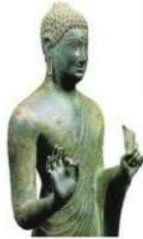
Hình 18.4. Tượng Phật Đồng Dương (tượng đồng, Quảng Nam, thế kỉ VIII - IX)