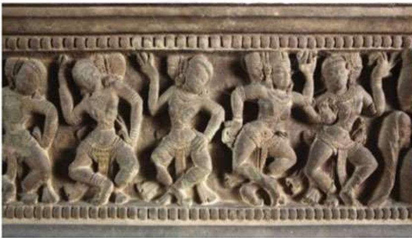
Hình 18.5. Hình trang trí trên Đài thờ Trà Kiệu (điều khắc đá, Quảng Nam, thế kỉ IX - X)