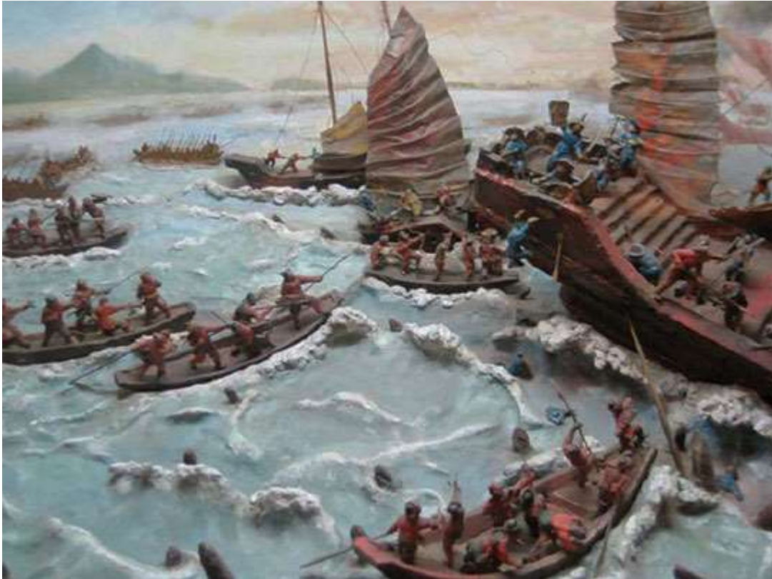
Hình 17.6. Chiến thắng Bạch Đằng năm 938 (mô hình - Bảo tàng lịch sử Quân sự)