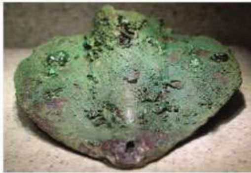
Hình 13.4. Lưới cây đồng Cổ Loa

1. Quan sát các hình từ 13.4 đến 13.6 và đọc thông tin, hãy cho biết những nghề sản xuất chính của cư dân Âu Lạc.