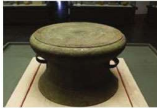
Hình 13.5. Trống đồng Cổ Loa