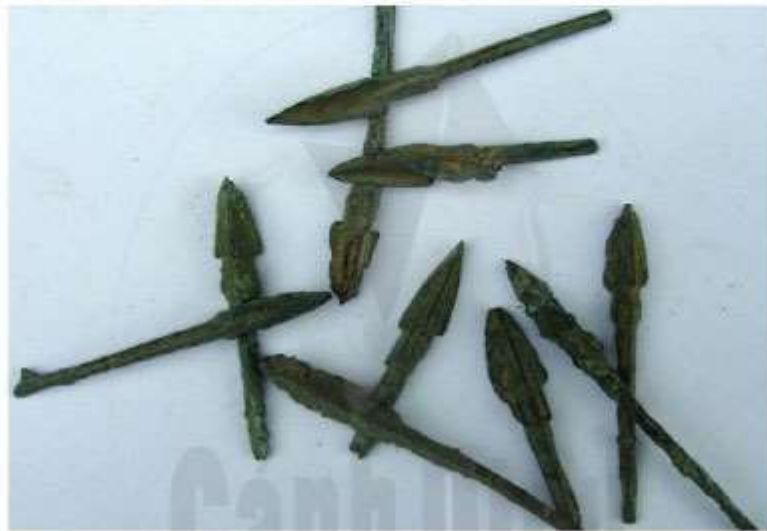
Hình 13.6. Mũi tên đồng Cổ Loa

2. Hãy mô tả đời sống vật chất và tinh thần của cư dân Âu Lạc.