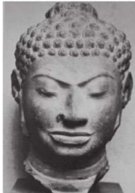
Hình 11.7. Đầu tượng Phật theo phong cách Đva-ra-va-ti (Thái Lan, thế kỉ VIII)