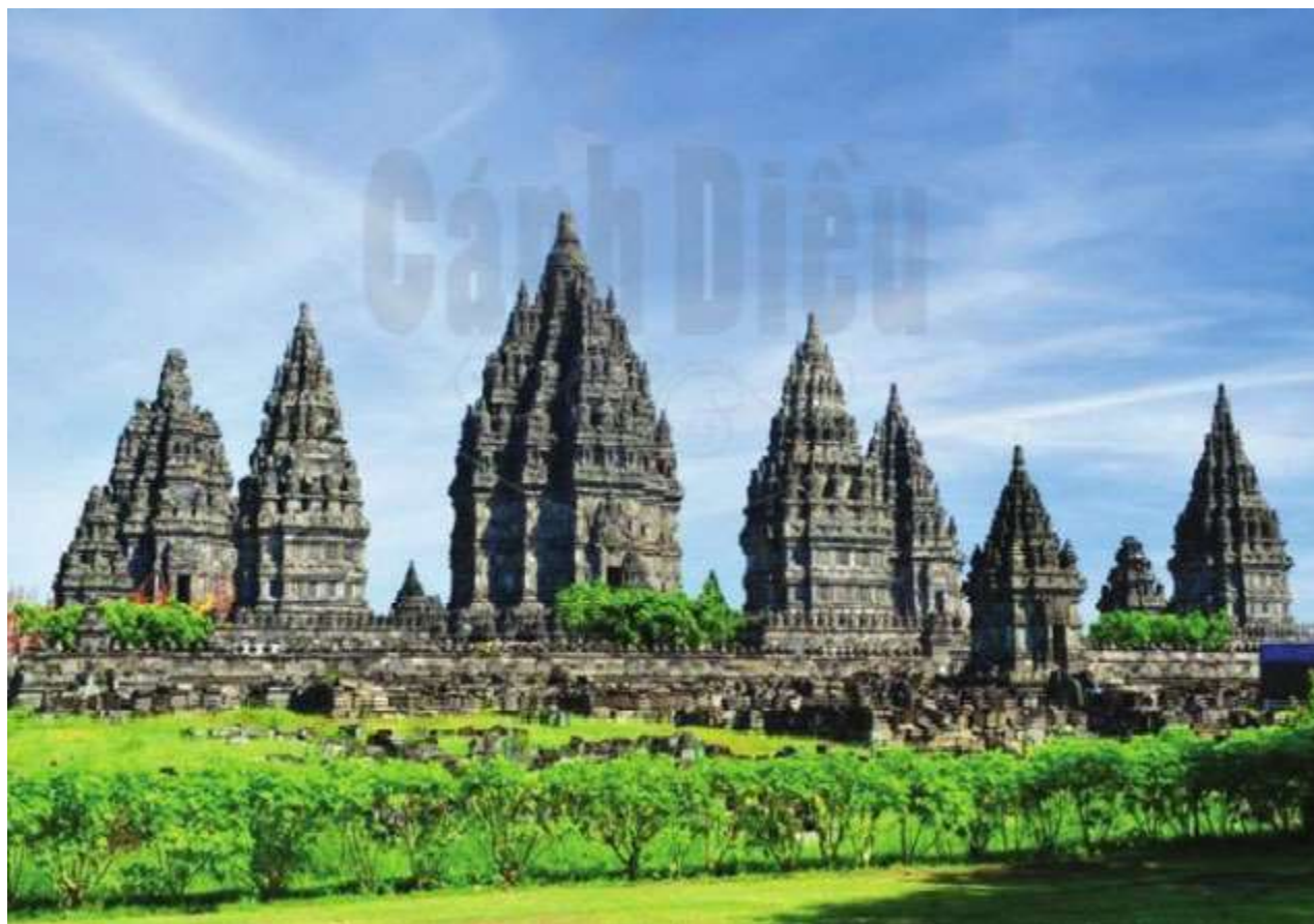
Hình 11.4. Đền Pram-ba-nan (In-đô-nê-xi-a, thế kỉ IX)