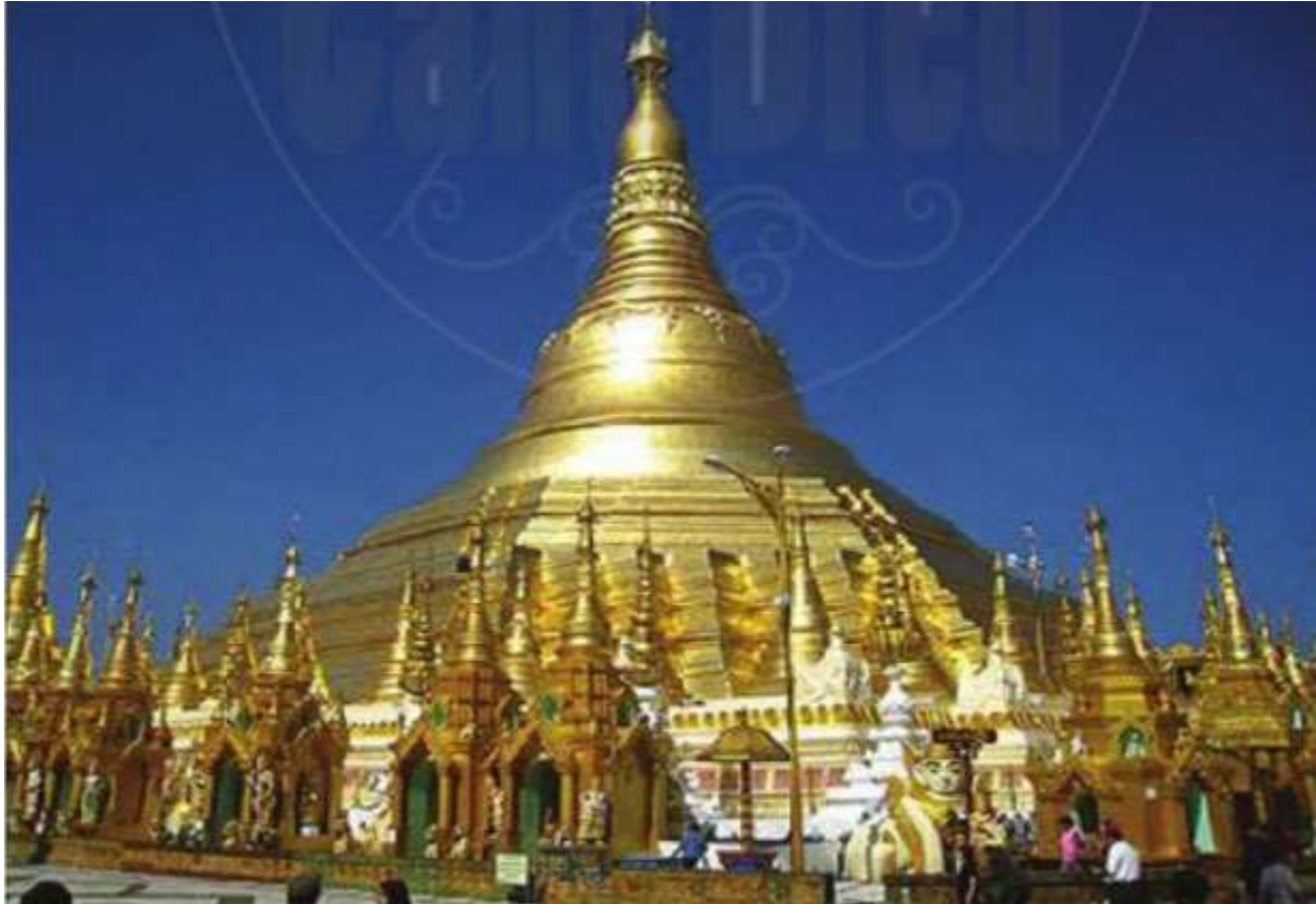
Hình 11.6. Chùa Suê-đa-gon (hay chùa Vàng) (Y-ăng-gun, Mi-an-ma, khoảng thế kỉ VI - X)