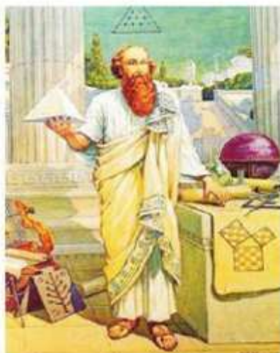
Hình 9.10. Tranh vẽ nhà toán học Pi-ta-go