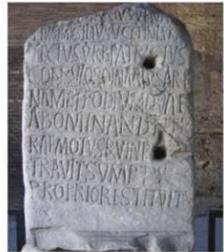
Hình 9.7. Văn khắc bằng tiếng La-tin ở đầu trường La Mã