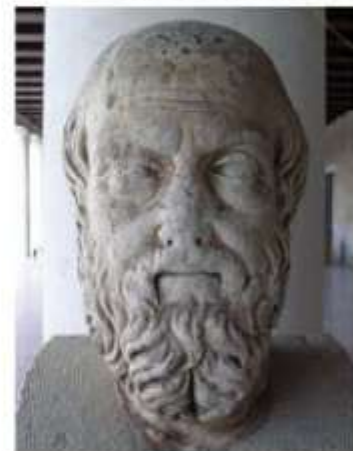
Hình 9.9. Tượng cẩm thạch Hê-rô-đốt tại Bảo tàng A-ten (Hy Lạp)