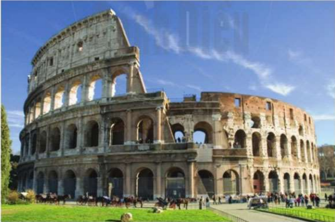
Hình 9.12. Đấu trường Cô-li-dê

2. Những thành tựu văn hóa nào của Hy Lạp và La Mã cổ đại còn được bảo tồn đến ngày nay?