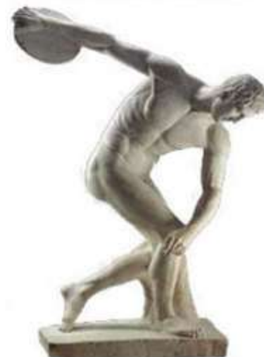
Hình 9.11. Tượng lục sĩ ném đĩa