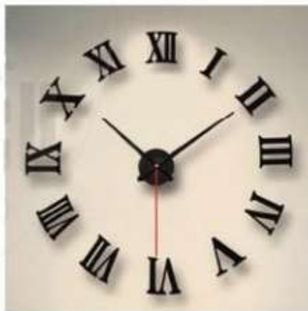
Hình 9.8. Mặt một chiếc đồng hồ sử dụng số La Mã