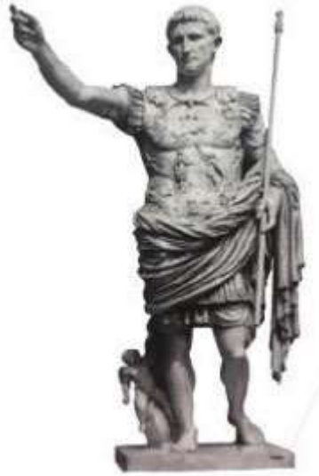
Hình 9.4. Tượng Ô-gu-xtu-xơ