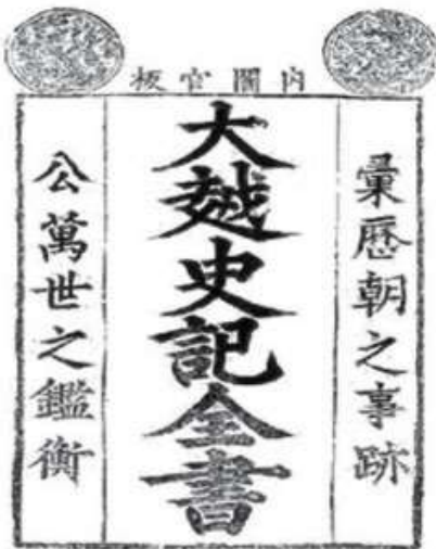
Hình 1.10. Cuốn Đại Việt sử ký toàn thư (bản in Nội các quan bản, 1697)