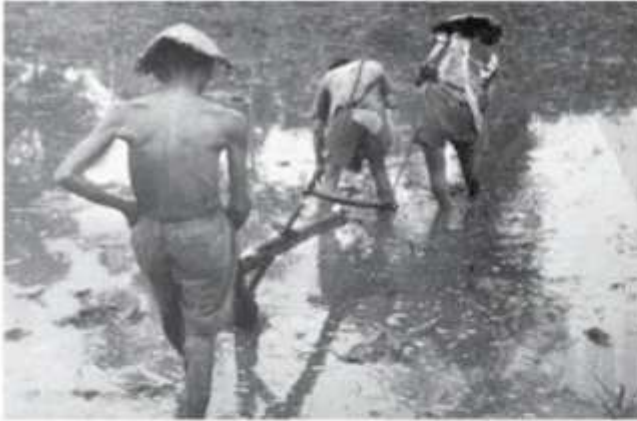
Hình 1.3. Nông dân cấy ruộng (thời Pháp thuộc)