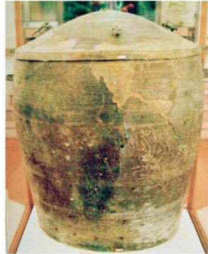
Hình 1.9. Thạp đồng Đào Thịnh (Văn hoá Đông Sơn, khoảng 2 500 – 2 000 năm trước)