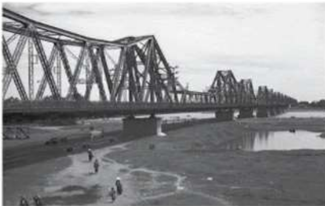
Hình 1.5. Cầu Long Biên, Hà Nội (xây dựng từ năm 1898 đến năm 1902)