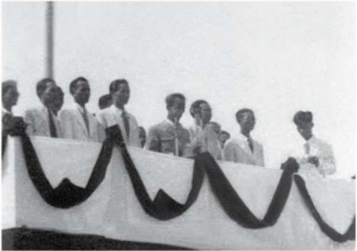
Hình 1.7. Chủ tịch Hồ Chí Minh đọc bản Tuyên ngôn Độc lập tại Quảng trường Ba Đình, Hà Nội (2-9-1945), thành lập nước Việt Nam Dân chủ Cộng hoà