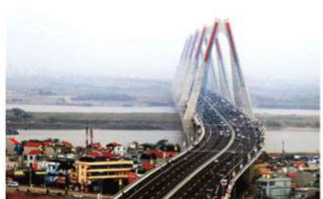
Hình 1.6. Cầu Nhật Tân, Hà Nội (xây dựng từ năm 2009 đến năm 2015)

2. Sự kiện trong hình 1.7 đánh dấu bước ngoặt lịch sử nào của dân tộc Việt Nam?