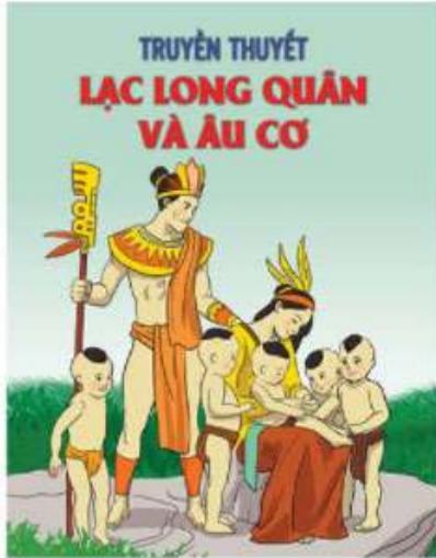
Hình 1.8. Truyền thuyết Lạc Long Quân và Âu Cơ (tranh minh họa)