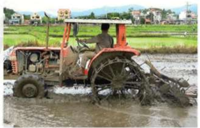
Hình 1.4. Nông dân cấy ruộng (thời Đổi mới)