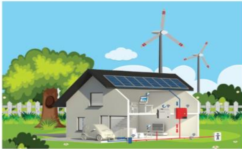
Hình 3.4. Ngôi nhà có hệ thống chuyển đổi năng lượng

Câu hỏi 2 trang 17 Công nghệ lớp 6 - Cánh diều: Hãy quan sát Hình 3.4 và cho biết ngôi nhà thông minh thu nhận năng lượng mặt trời, năng lượng gió bằng thiết bị nào?