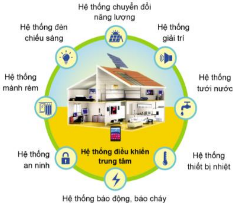
Hình 3.1. Các hệ thống trong ngôi nhà thông minh