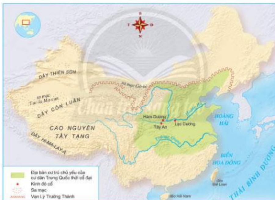
9.2 Lược đồ khu vực cư trú ban đầu của người Trung Quốc cổ đại