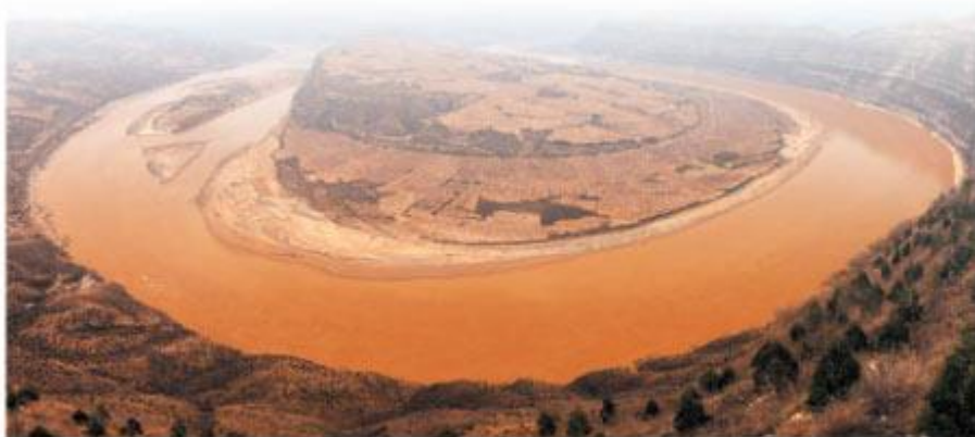
9.1 Một đoạn Hoàng Hà