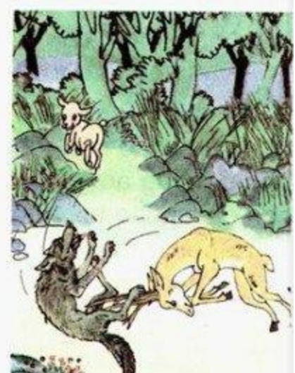
Lần khác nữa...