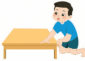
a) Đo bằng gang tay