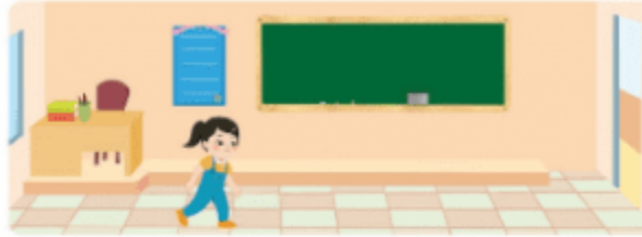
b) Đo bằng bước chân