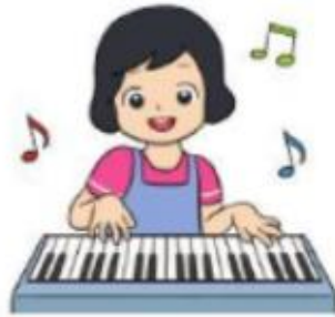
Loan tập đàn lúc 19 giờ.