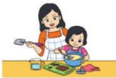
Loan giúp mẹ làm bánh lúc 15 giờ.

Chọn đồng hồ thích hợp với mỗi tranh vẽ: