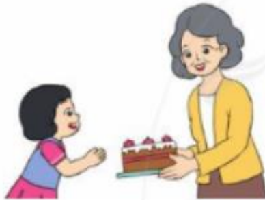
Loan mang bánh biếu bà lúc 17 giờ.