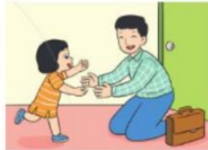
Bố Loan đi công tác về lúc 20 giờ.