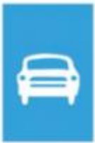
Hình chữ nhật

a, Quan sát mỗi biển báo giao thông và cho biết hình dạng của nó: