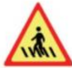
Hình tam giác